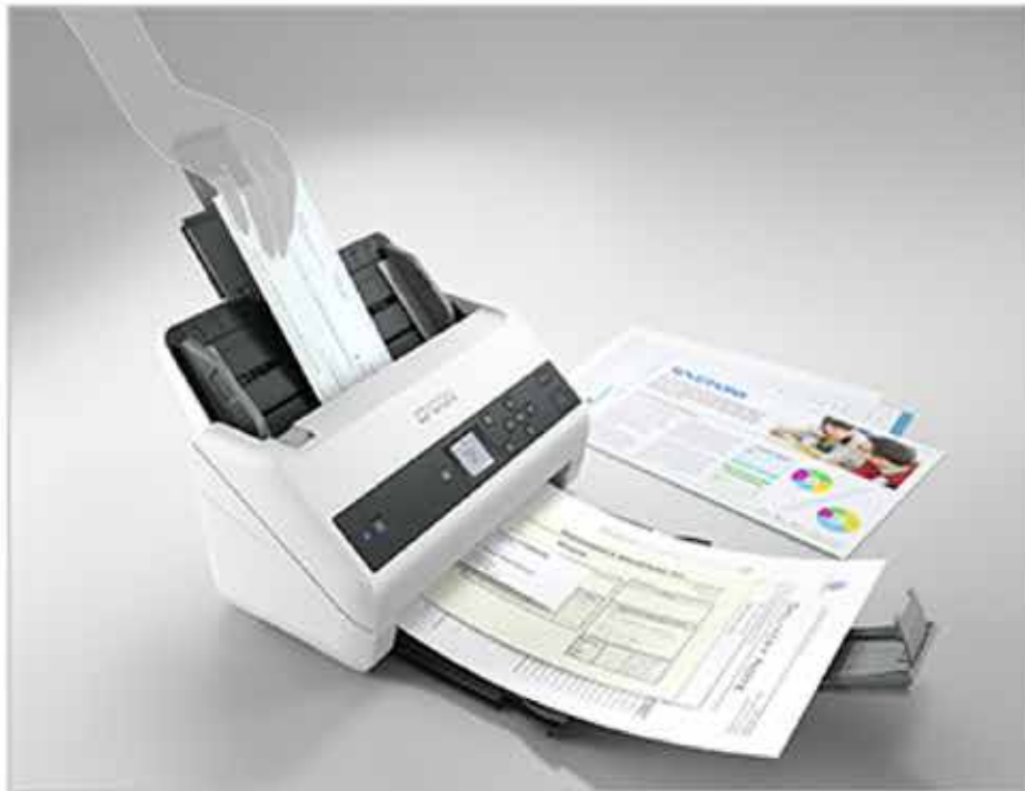
<다양한 용지 크기 스캔 가능>