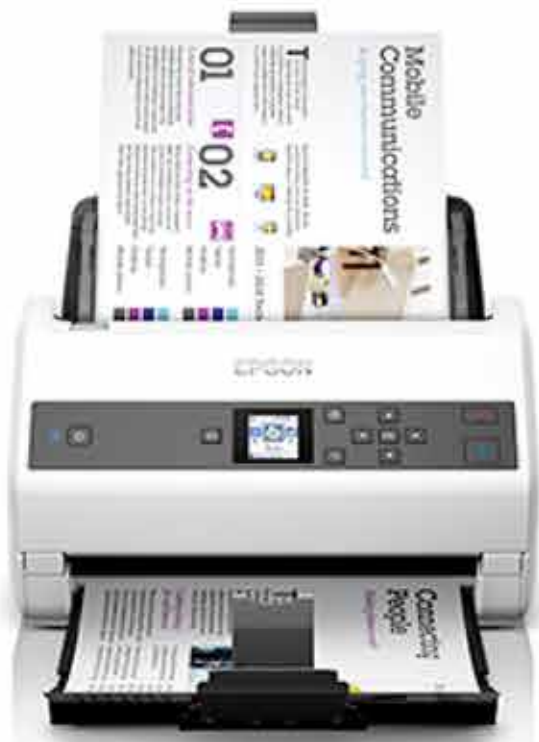
<저속 모드 스캔을 통해 원고의 손상 예방>

Epson WorkForce DS-970은 찢어지기 쉬운 원고 스캔을 위해 안정적인 “저속 모드 스캔”을 지원합니다. 또한, 라벨 등이 부착된 원고의 스캔 작업을 위해 “이중 급지 감지 건너뛰기” 기능을 제공합니다.