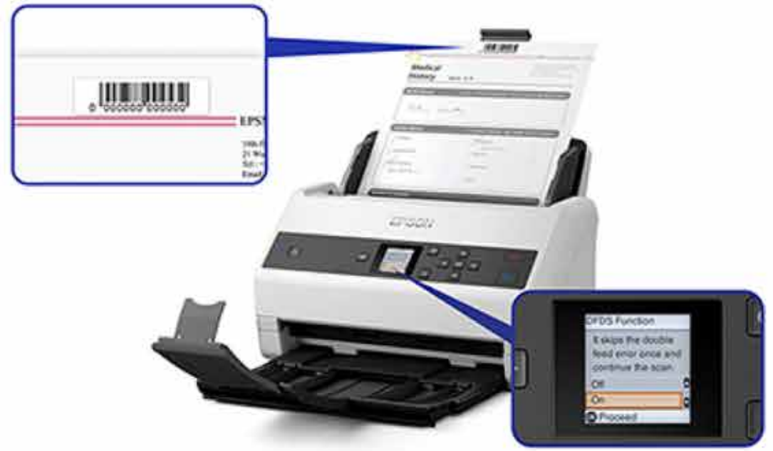
<라벨이 부착된 원고도 문제없이 스캔 가능>