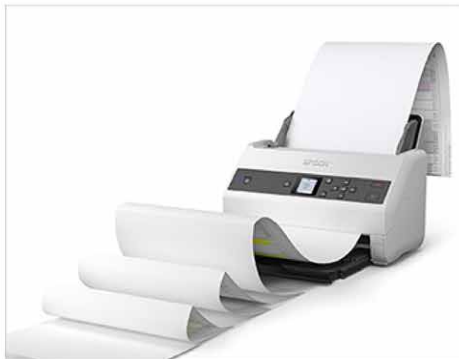
<최대 6M길이의 긴 용지 스캔 가능>