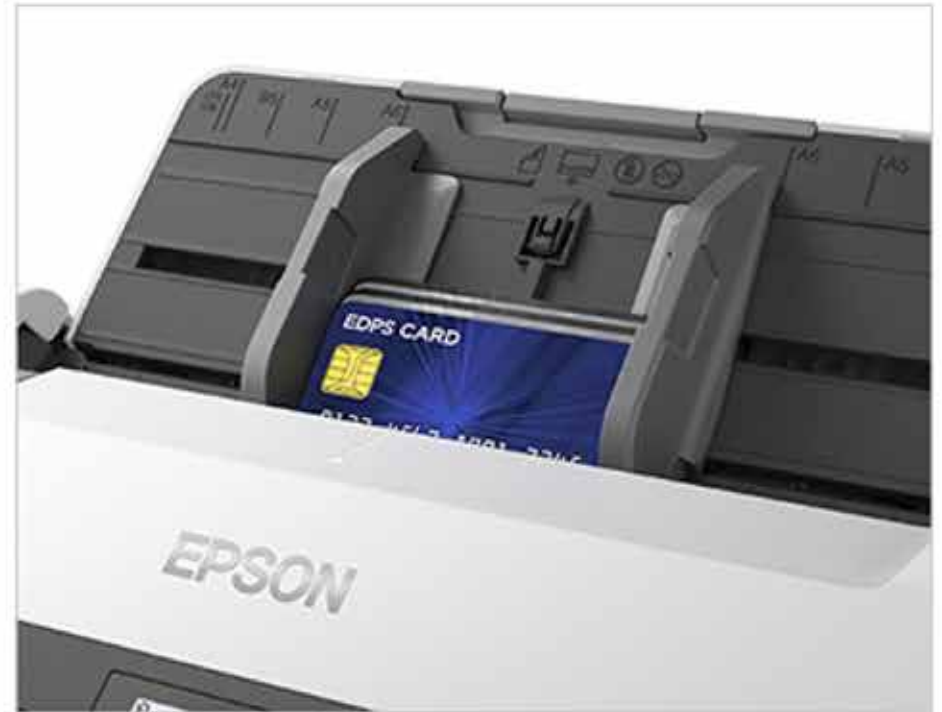
<플라스틱 카드 스캔 가능>